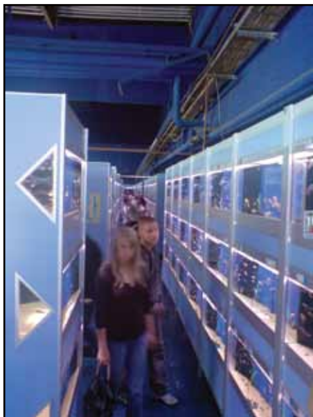
Långa gångar på Zoo Zajac.