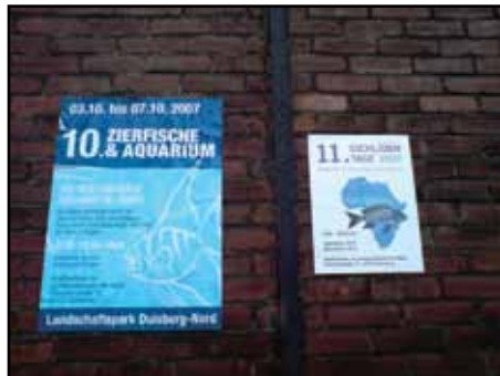
Reklamposter för mässan och de tyska ciklidvännerna.

Väl uppe på bussen och iväg över bron mot kontinenten var det en trevlig stämning med många glada återseenden. Som på många andra bussresor fanns det ett gäng längst bak i bussen som höll igång lite längre än oss andra men de hade ändå hyfs att hålla volymen så låg att det inte innebar något problem för dem som ville sova.