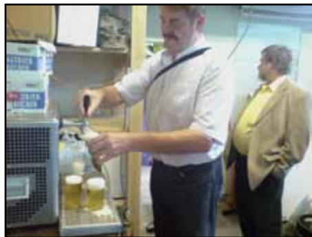
Samling vid pumpen hos Hobby Zoo Tillmann.

Denna förhållandevis lilla affär var förra årets stora överraskning och utnämndes av flera av de svenska akvarister som besökte Duisburg förra året till den resans höjd-