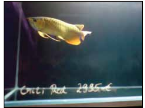
Mässans dyraste fisk, en Red Chilli arowana för 2995 euro.

fisk- och akvarieväxtodlare visar upp spännande djur, växter och tillbehör. Så gott som alla utställare säljer sina produkter till mässpriser som ligger långt under de redan låga priserna i Tyskland. Detta år arrangerades också det tyska ciklidsällskapet "Cichlidentage" under mässan.