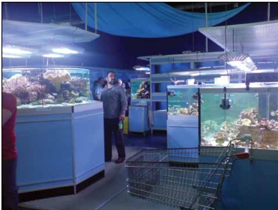
Zoo Zajacs saltavdelning. Här handlar man med kundvagn.

rieavdelningen tar med sina drygt 1000 akvarier upp störst yta i butiken, följd av terrariedelen med 500 terrarier. Zoo-Zajac är inte en av Tysklands billigaste affärer och trots sin storlek inte heller den affär som har mest sällsynt fisk men tack vare dess storlek går det att tillbringa många timmar där oberoende av om man shoppar loss eller bara låter sig inspireras. Deras utbud av akvarietillbehör överträffas nog inte av någon affär. Ett tips är att det går att beställa deras katalog gratis på deras hemsida. Den är större och tjockare än en IKEA-katalog och är 500 sidor ren akvariepornografi.