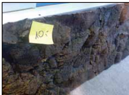
Snygga och billiga bakgrunder. Endast 10 euro!

Efter ett frukoststopp på torsdagsmorgonen kom vi fram till Zierfische & Aquarium-mässan lagom när de skulle slå upp portarna. På mässan finns världens alla ledande akvarietillbehörsmärken samt Europas största akvarieaffärer representerade. Även många mindre importörer och