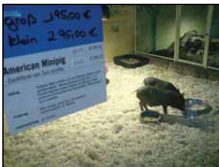
På Zoo Zajac säljs alla möjliga djur.

Efter mässbesöket var det dags för lunchpaus innan vi skulle ge oss in i världens största akvarieaffär, med ett extremt stort sortiment inom allt som rör husdjur. Akva-