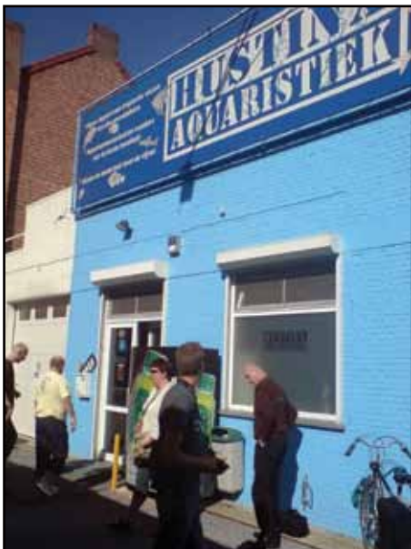
Hustinx Aquaristiek, Hasselt Belgien.