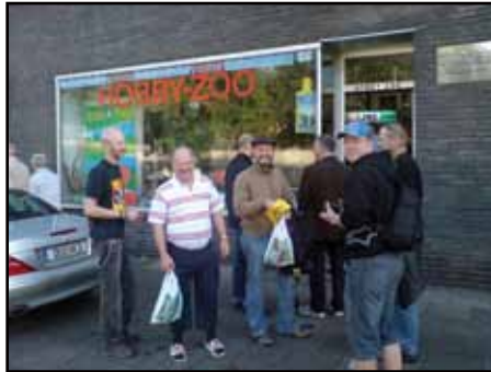
Glada akvarister utanför Hobby Zoo Tillmann.

punkt. Bröderna Tillmann kallar sin affär för ett paradiset för dem som gillar Syd- och Mellanamerikanska ciklider och det är ingen överdrift. Aldrig har någon sett så många lekpar med yngel i en affär som i denna. Akvarierna var fyllda med syd- och centralare i utmärkt kondition. Dessutom fanns det en hel del intressant annan fisk, västafrikaner, ovanliga levandefödare och annat. Det visade också sig att de även här hade installerat en ölpump i år och det var fritt fram för var och en att ta för sig. Kanske bidrog det till att denna affär, trots att det var resans minsta, i år blev den affär där vi på bussen handlade mest fisk.