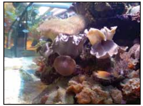
Saltvatten hos Aquatop.

mig om övriga delar av affären. Vi som sysslar med salt köpte i alla fall så mycket i den här affären att vi fick det levererat i frigitkartonger till affärens monter på mässan nästa dag. Bra service som gjorde att de känsliga saltvattensfirrarna fick en natt mindre i påsarna.