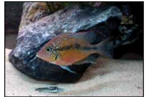
Thorichthys sp., hona som vaktar ägg på mässan.