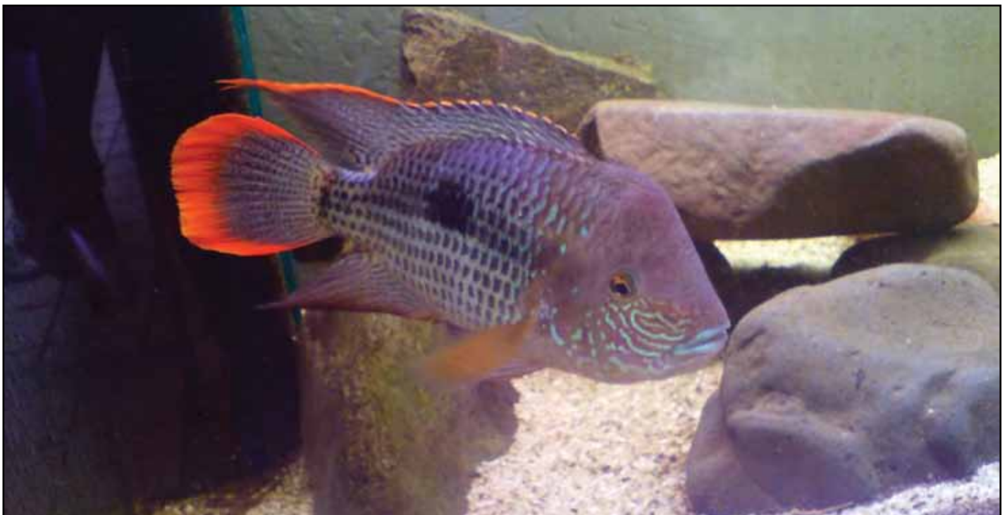
Vildfångad guldsömciklid, Aequidens rivulatus , hos Hobby Zoo Tillmann.

Denna affär låg på gränsen till Belgien och passade utmärkt in i vår resrut. Med en lokal på över 5000 kvadratmeter och fler än 30 anställda är detta en av Europas största akvarieaffärer. Här fastnade jag och de andra saltvattensakvaristerna på saltvattensavdelningen så jag kan inte uttala