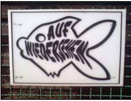
Skylt vid utgången till Diskus Center royal.

det var ölet eller något annat som gjorde det är svårt att säga men här fastnade många framför ett akvarium med en stor lekgrupp Hypancistrus zebra med massor med yngel. Med tanke på de priser denna fisk betingar simmande det nog närmare en årslön för en handelsanställd i det lilla akvariet.