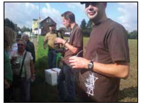
Vid rasterna hade chaufförerna den goda vanan att servera Irish Coffee och fika.